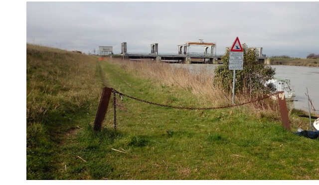
foto 3 nuova sbarra