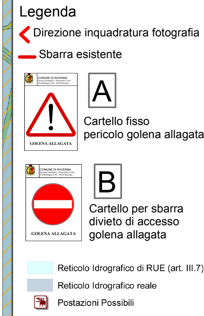
foto 1 sbarra esistente