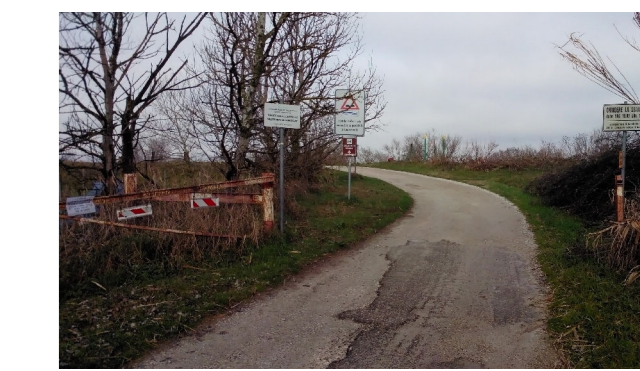
foto 2 catena esistente