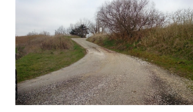
foto 4 nuova sbarra